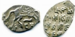
Серебряная копейка Петра I

Оформление монеты при Петре приобрело отчетливый европейский характер. На лицевой стороне помещался царский портрет с указанием достоинства, года выпуска и места чеканки, а на оборотной - государственный герб. Чтобы защитить монеты от подделки, стали наносить надпись или особенный узор . К концу царствования Петра I в денежном хозяйстве страны применяли три основных металла.