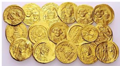
Начало собственной чеканки

В 988 году Русь приняла христианство. Это означало, что она заняла свое место среди европейских держав, большинство из которых уже были христианскими. Уничтожив в Киеве языческих идолов и построив Десятинную церковь, великий князь Владимир Святославич решил ввести выпуск собственных монет по образцу византийского Солида. На их аверсе был изображен сам великий князь: в правой руке — крест, левая рука прижата к груди. На голове - великокняжеская шапка, увенчанная крестом и подвесками. Здесь же помещалась поясняющая надпись: Владимир на столе. На оборотной стороне монеты был изображен Иисус Христос в царском венце с Евангелием в одной руке и поднятой в благословении другой. По сторонам изображения шла надпись: Иисус Христос. Монета содержала 2-3 грамма чистого золота, поэтому и стала называться златником. Помимо златника появился еще и серебряник, созданный в подражание византийскому милиарисию. Масса этой монеты также составляла 2-3 грамма. На лицевой стороне был изображен великий князь, на оборотной - Иисус Христос.