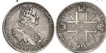
Серебряный рубль Петра I

Главным денежным средством оставалась серебряная копейка, которую по-прежнему чеканили из проволоки. В 1704 году был выпущен серебряный рубль, придавший денежной системе Петра законченный вид.