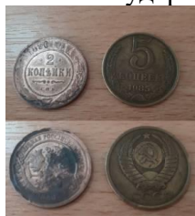
Деньги в Древней Руси

Непосредственно изучением этого вопроса занимается такая вспомогательная историческая дисциплина, как нумизматика. В этой статье мы с вами рассмотрим становление и эволюцию денежной системы в России, начиная с момента формирования древнерусского государства и заканчивая современностью.