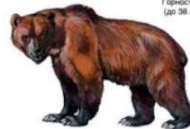
Бу́рый медведь (до 2,5 м)