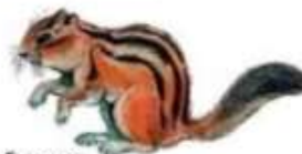
Бурунду́к (до 16 см)