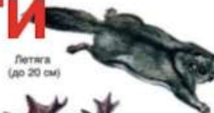
Летяга (до 20 см)