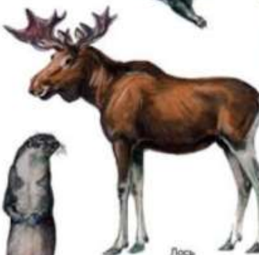
Лось (до 3 м)