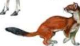
Горноста́й (до 38 см)