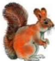
Белка (до 28 см)