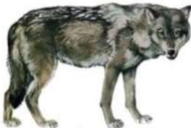
Волк (до 1,6 м)