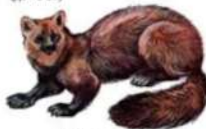
Соболь (до 53 см)