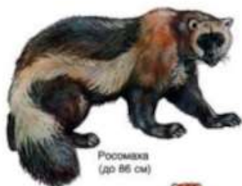
Росомаха (до 86 см)