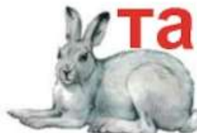
Заяц-беляк (до 74 см)