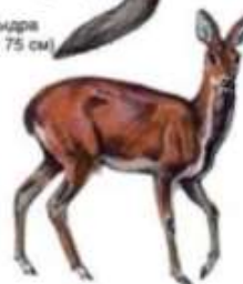
Кабарга (до 1 м)