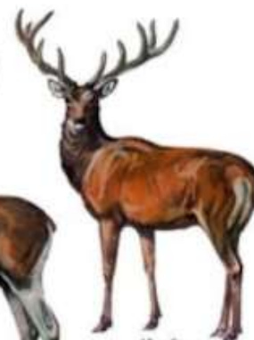
Изюбрь (до 2 м)